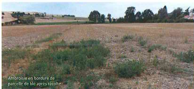
Ambrosie en bordure de parcelle de blé après récolte

Les cultures intermédiaires et autres couverts, s'ils sont mis en place rapidement après la récolte avec une installation rapide, apportent une compétition à l'ambrosie pour l'espace et les ressources. Ces couverts sont d'autant plus efficaces s'ils très couvrants (choisir des espèces adaptées).