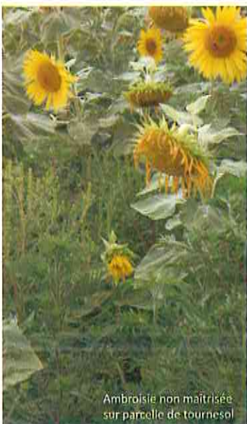
Ambrosie non maîtrisée sur parcelle de tournesol